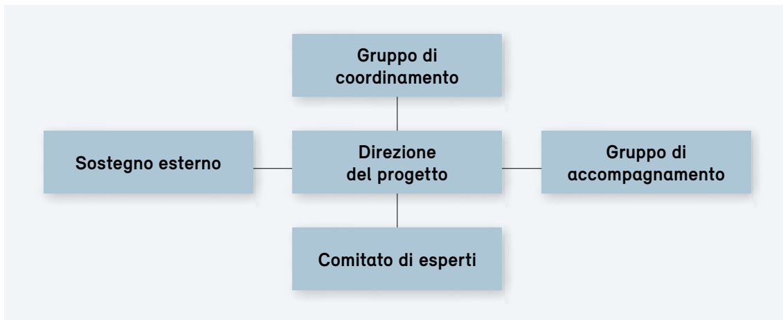
Figura 1: Organigramma rappresentativo della struttura gerarchica e dei collegamenti tra tutte le istanze.